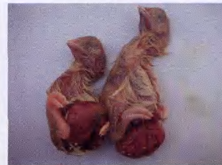
大肠杆菌感染种蛋造成胚胎卵黄囊发炎