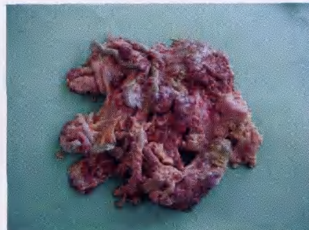
大肠杆菌肉芽肿, 肠粘连