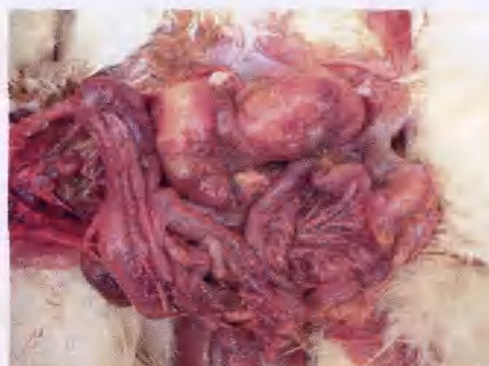
大肠杆菌引起出血性肠炎和输卵管炎