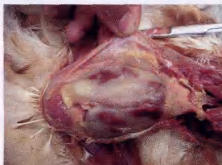
大肠杆菌与支原体混感包心包肝, 气囊下 有干酪样物