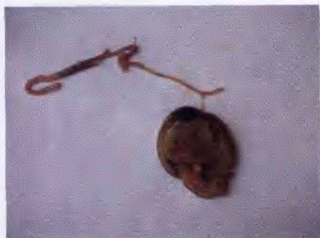
大肠杆菌感染卵黄囊变性