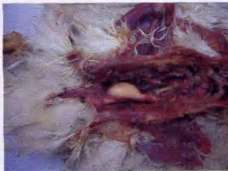
大肠杆菌造成的雏鸡输卵管炎内有干酪样物