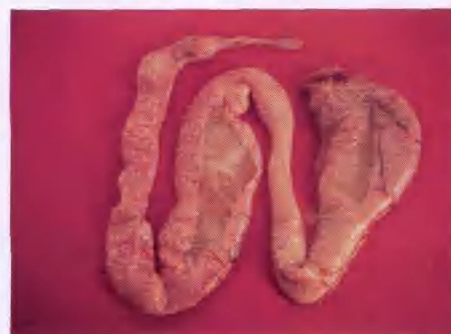
大肠杆菌造成输卵管水肿, 发炎内有 浆糊样分泌物