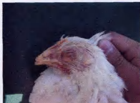
大肠杆菌引起炎症眼