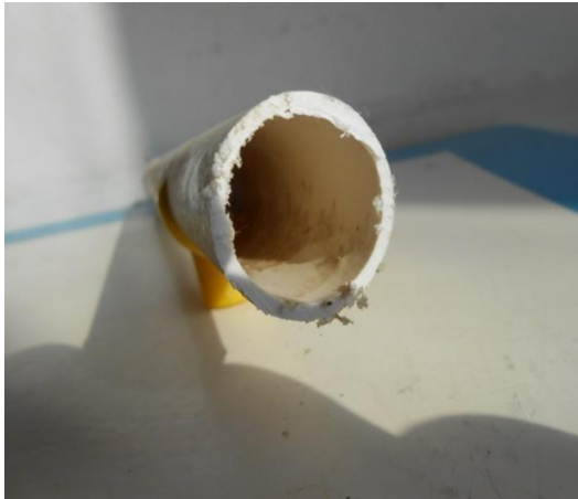
电解水消毒前管路

通过在北京某农业科技股份有限公司的蛋鸡饮水管线中添加一定比例的氧化电位水，进行长期饮水的试验证明：电解水能有效去除饮水管线的生物膜并提升产蛋的品质。下图所示为电解水对饮水管线进行消毒前后的对照比较。