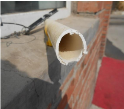
电解水消毒后管路

从上图的比较可以看出，采用添加一定比例的电解水进入饮水管线持续一定时间（本次试验持续一个月）后，饮水管线内部的生物膜和脏物得到明显改善。表 1 所示为长时间在鸡的饮水管线中添加一定比例的电解水，让鸡长时间饮用电解水后，对鸡的综合生产指标进行统计比较的数据结果，从表 1 中的数据可以看